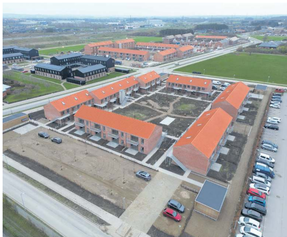
Første etape af nyt boligbyggeri på Kasernegrunden er nu klar og de første er flyttet ind.

Han understreger samtidig, at man allerede nu er velkommen til at se og høre mere til boligerne i EDC-butikken i Nørregade, hvor han