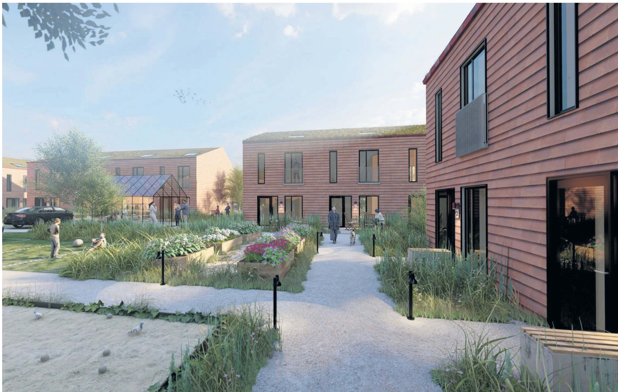
Maycon A/S skal forestå bebyggelsen af Stenlængeområdets 3 store parceller i Næstved med i alt 130 – 150 lejeboliger. Illustration: Maycon