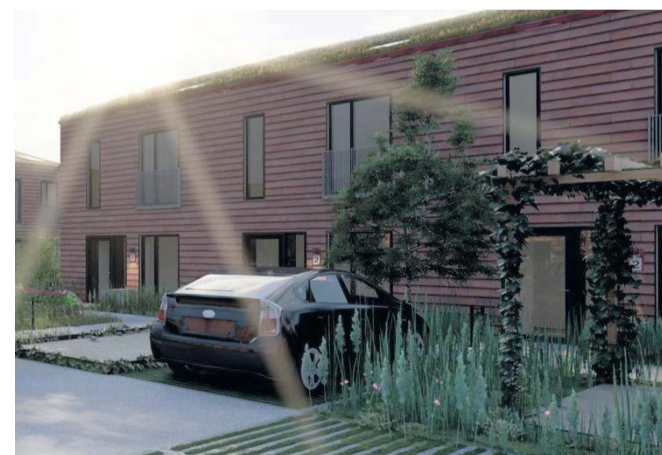
Maycons bebyggelse i Stenlængeområdet bliver en blanding af etageboliger i tre etager samt rækkehuse i to plan. Illustration: Maycon

Boligerne bliver i størrelser med to-, tre- og fire rum på