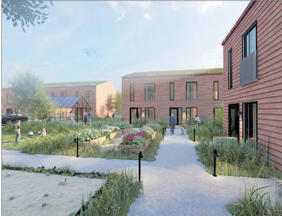
Næstved Kommune har lagt vægt på, at der bliver gårdrum, og det lever Maycons projekt op til, ligesom boligerne får sydvendte altaner. Her et eksempel på havemiljø og udeområder.